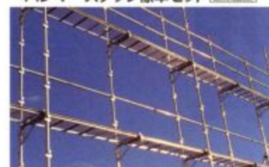
■ホリー 一側足場(ブラケットタイプ)5スパン3層セットの仕様