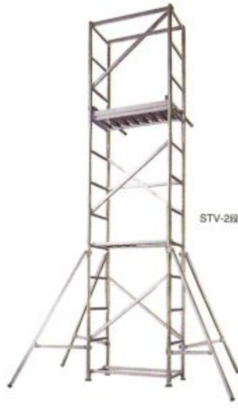
■ハセガワ ローリングタワー SM型の仕様 最大使用重量: 200kg

アルミ製の作業タワーで、快適な作業環境を提供します。組立ては、ジョイントとプレスによるワンタッチ方式です。