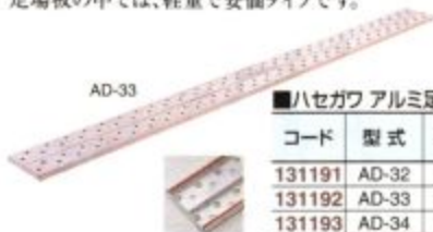
■ハセガワ アルミ足場板 アルステージ® AD型の仕様 最大使用重量: 120kg

滑り止めとして円周フランジ加工を施した、片面使用タイプのアルミ製軽量足場板です。足場板の中では、軽量で安価タイプです。