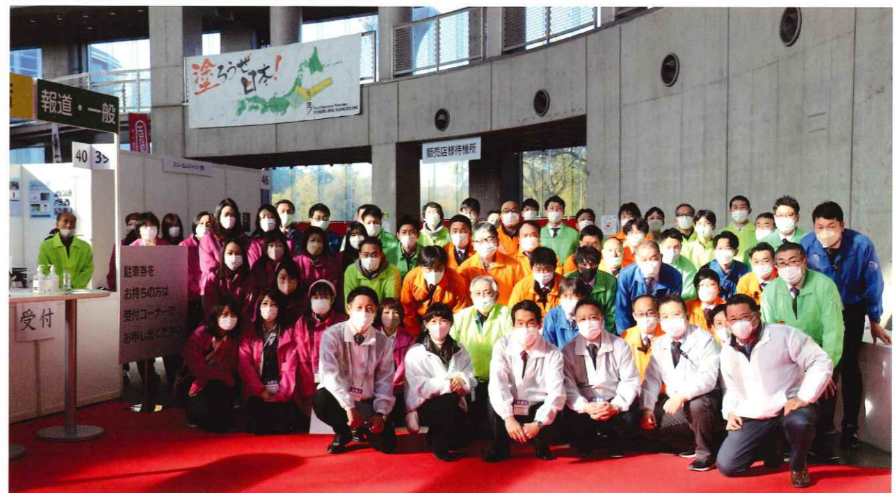
2023年2月に開催した展示即売会「近畿マルヨシフェア」集合写真 ※当時コロナ禍の為マスク着用