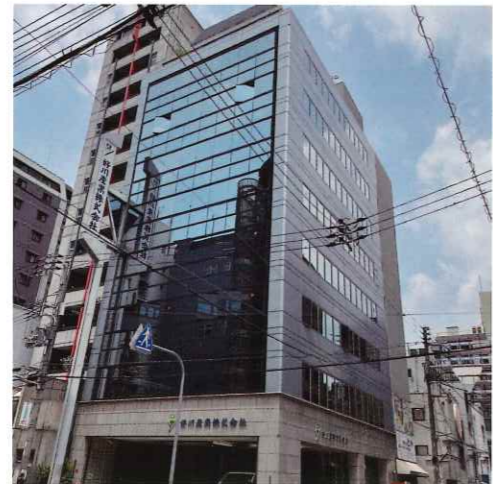
▲ 現在の大阪本社ビル

私たちは暮らしを彩り豊かにしていくことに欠かさない「色」を「ペイントする」ためのツールを取り扱っています。そのツールは「刷毛」「ローラー」「筆」「ブラシ」をはじめとする塗装用具全般におよび、高度な職人技にふさわしいプロツールの開発・提供を行っています。近年は社会インフラ整備に特化した商品、工法の開発や普及活動にも力を入れています。