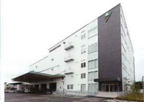
▲ 2020(令和2)年8月に完成した新社屋・物流センター